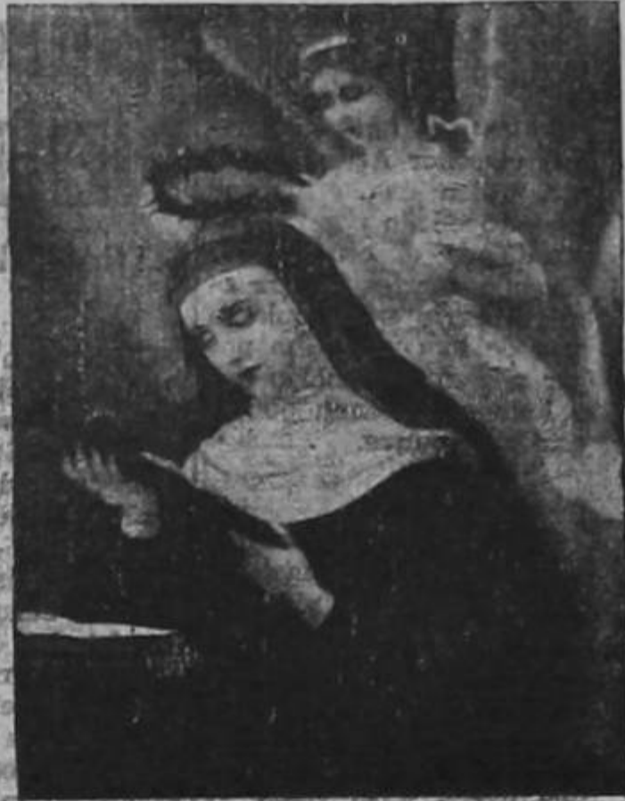
SANTA RITA (Abogada de los Imposibles)